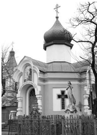
Часовня при Всехсвятской церкви.

Члены причтов городских церковей при всем своем желании поддерживать могилы умерших родных в благоприличном виде не имеют к тому возможности, особенно это нужно сказать о вдовых и осиротелых семействах состоявшего на службе при городских церквях духовенства. Крайняя нужда