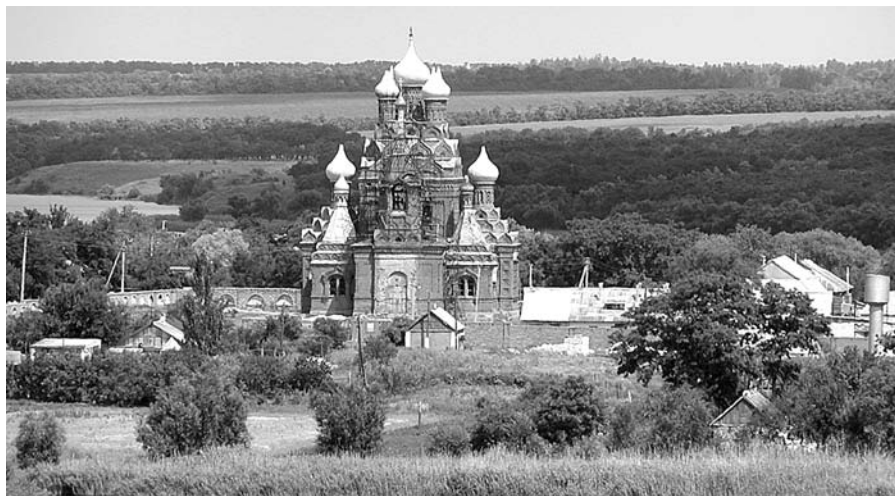
Церковь в с. Пеллагеевка Свято-Михайловского монастыря