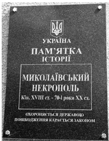
Памятная мемориальная доска у ворот некрополя