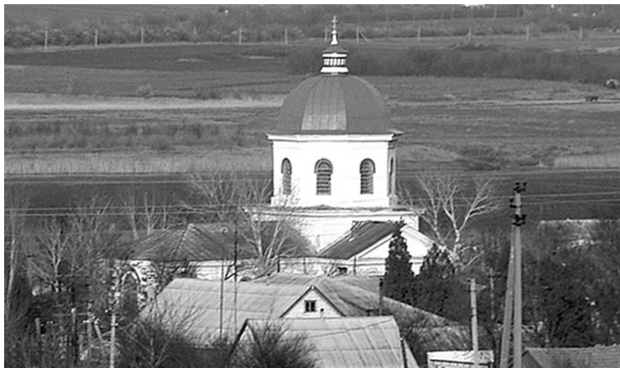
Село Васильевка. Церковь Рождества Христова.

В 1930 году Свято-Никольский храм, в котором служил отец Карп, был разрушен... Но вот ведь чудо: каждый год в Пасхальную ночь, когда крестный ход отправляется от дверей ныне действующей церкви, процессия людей с крестами, хоругвями и свечами точно обходит вокруг не существующего нынче храма, повторяя тот же путь, по которому много десятилетий назад ходили бывшие прихожане.