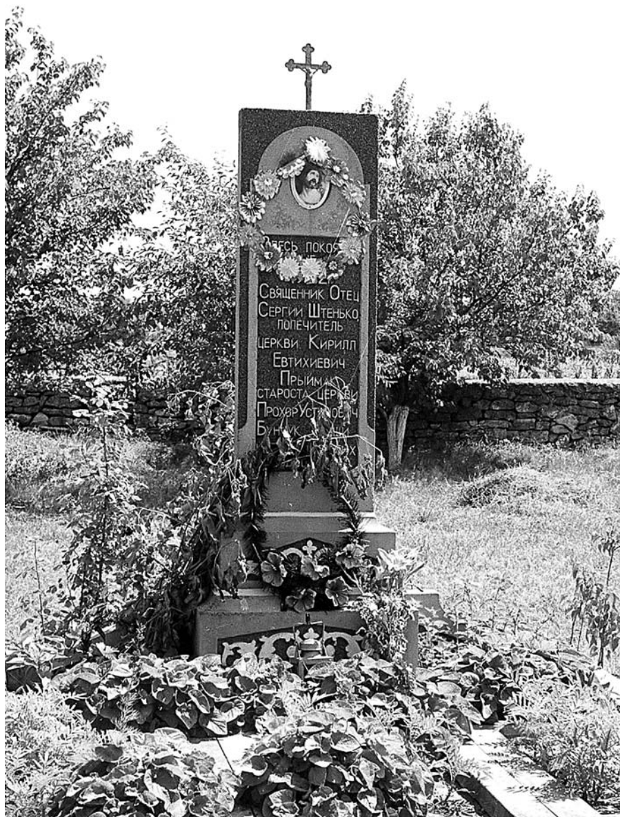
Памятник, где покоятся новомученики села Васильевка.