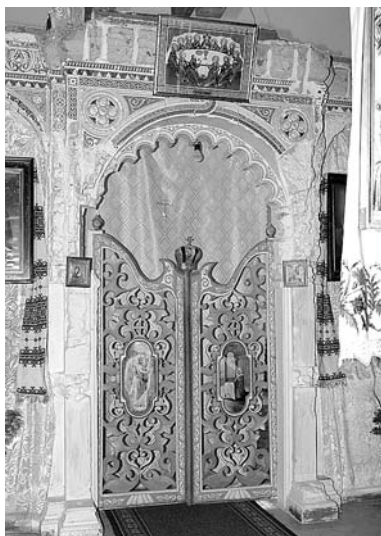
Царские врата и часть иконостаса в с. Пеллагеевка.