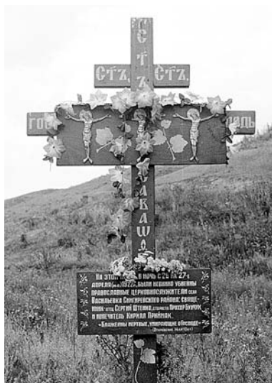
Памятный крест на месте кровавой трагедии.