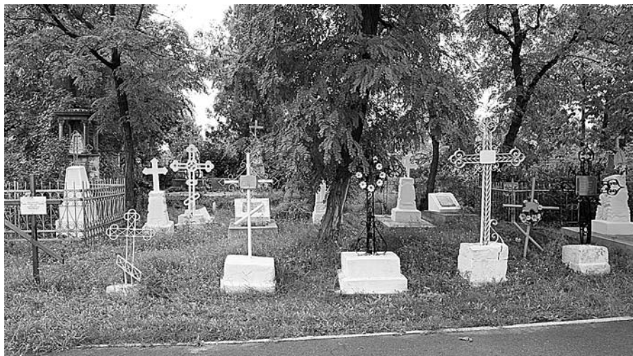
Старое кладбище. Могилы священнослужителей.