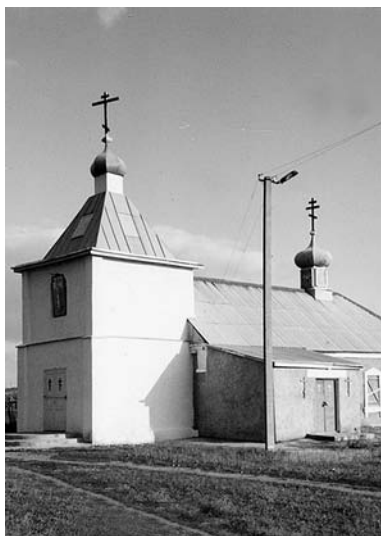
Храм в бывшем доме священника. (с. Мешково-Погорелово).