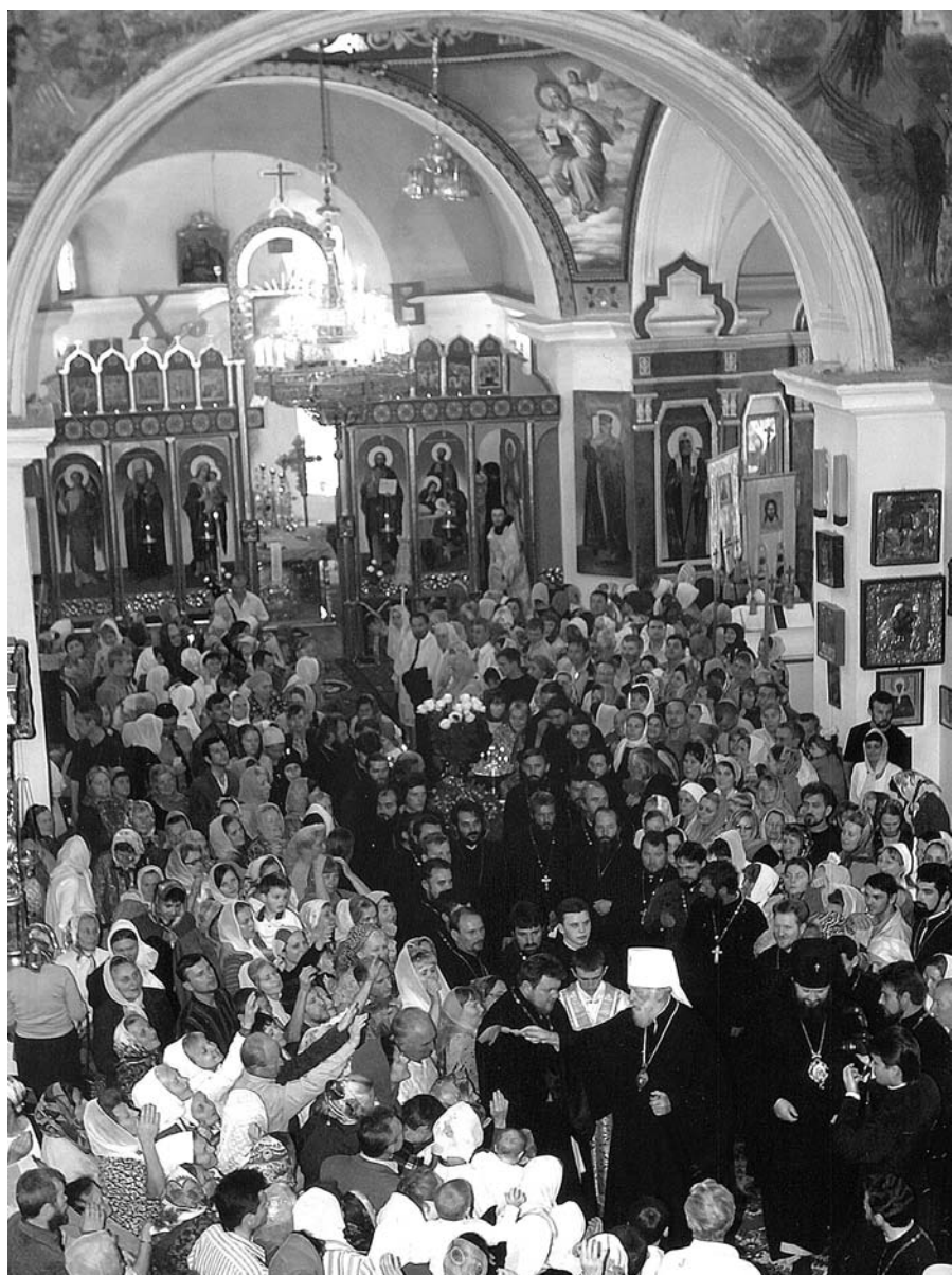
Митрополит Киевский и Всея Украины Владимир (Сабодан) в Рождество-Богородичном соборе. 2005 г.