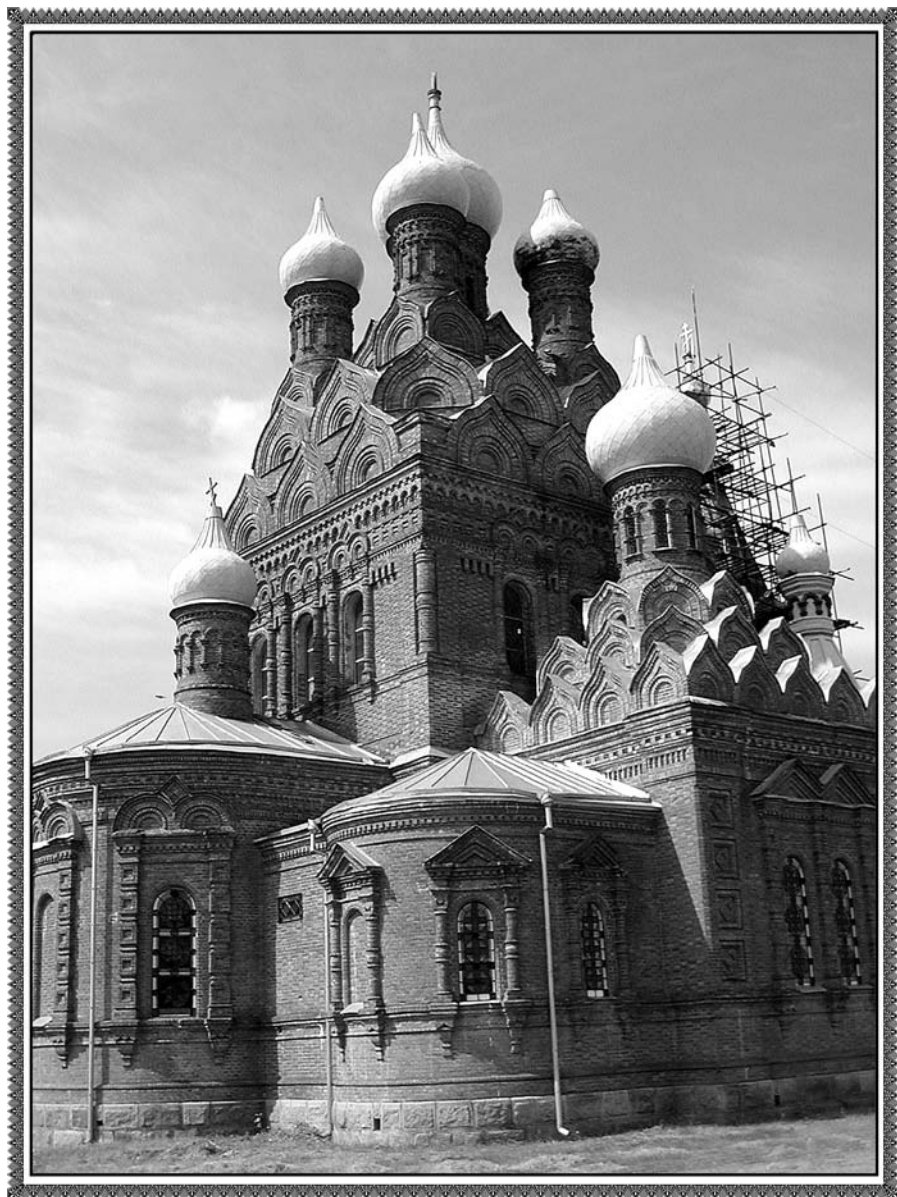
Свято-Михайловская церковь в с.Пелагеевка Новобугского р-на.