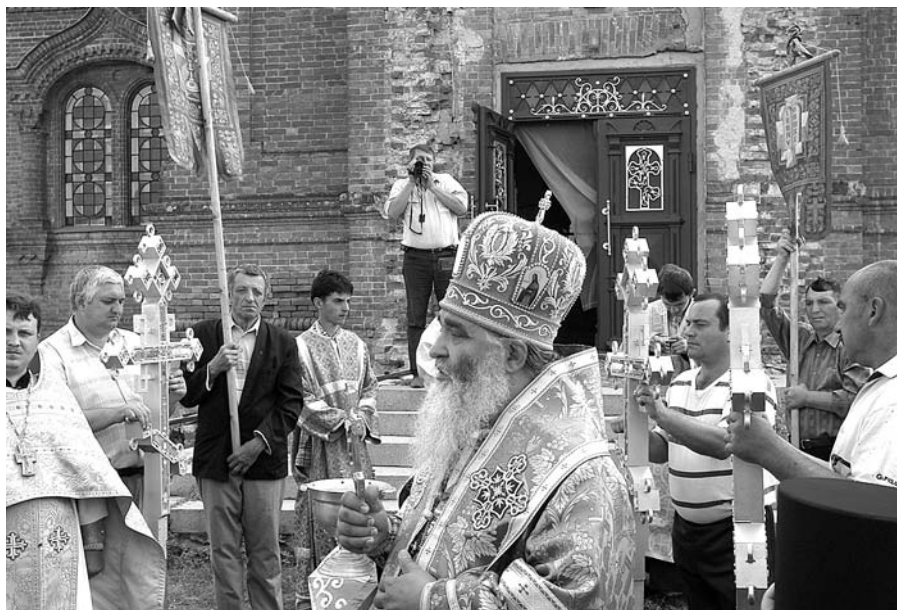
Освящение вновь устанавливаемых крестов и куполов. 2006 г.