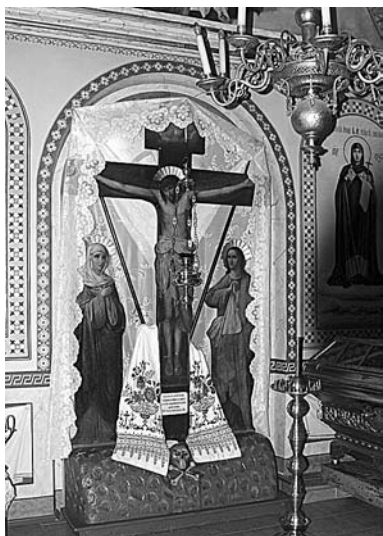
Святое распятие. 1906 г.

«К утверждению означенного плана в техническом отношении препятствий не встречается с тем, чтобы: 1) все лестницы были устроены из нескораемого материала; 2) над воротным проездом устроено было нескораемое сводчатое перекрытие; 3) дом сложен был на известковом растворе; 4) в углах здания уложены были железные (сваи)...» и т. д.