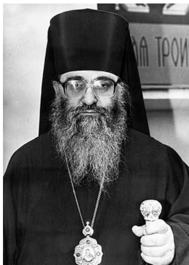
Архиепископ Николаевский и Вознесенский Питирим (Старинский).

Николаевско-Вознесенская епархия сегодня – это сложившаяся