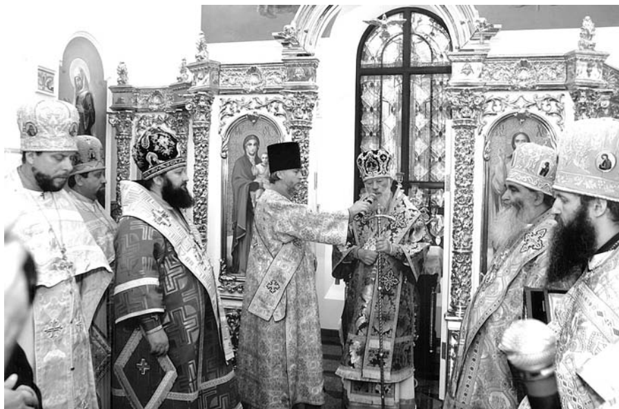
Освящение часовни во имя Святого Николая. 2005 г.