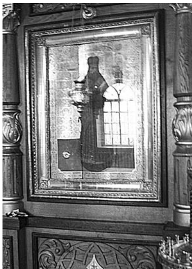
Икона Преподобного Феодосия Черниговского.