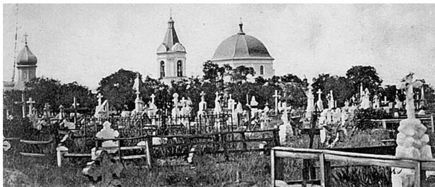
Вид старого кладбища.

Часовня на могиле В.Н. Каразина, основателя Харьковского университета. мации, привлекая внимание горожан к данной теме. Телепередачами и газетными статьями они способствуют пробуждению у горожан интереса к истории города и людям, к своим семейным корням – поскольку каждый коренной житель города имеет на кладбище семейный склеп или погребение предков. Иллюстрацией вышесказанного могут служить статьи Н. М. Христовой, одну из которых мы приводим как приложение к очерку.