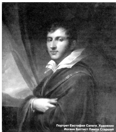
Портрет Евстафия Сапеги. Художник Иоганн Баттист Лампи Старший

Портрет Евстафия Сапеги Художник И.Б. Лампи Старший