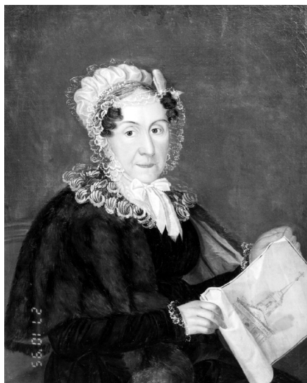
Один из последних портретов А. Браницкой

Проживание Браницких обходилось дворцу до 200 000 рублей в год, по 400 рублей в день, о чем сокрушался князь Безбородко в докладах государыне.