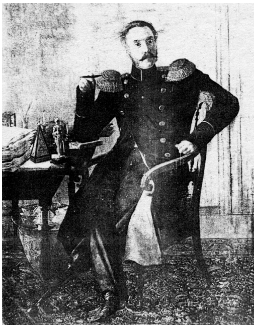
Портрет Ивана Карловича Арнольди Художник Е.Ф. Крендовский (1847)

Личность изображенного вызывает особое внимание. «Много характера» чувствуется в ней, уверенности в своей значительности. Поза явно претенциозная. Гордая и вольная: непринужденно закинута нога на ногу, будто демонстрируя деревянный протез левой ноги (портрет мог быть поколённым). Забывая, что перед тобой только портрет, думаешь житейски: «...пишет в кабинете, не в походе, а только что не в шинели..., ведь неудобно, стесненно...». Но перед нами полевой генерал, который между походами пишет мемуары.