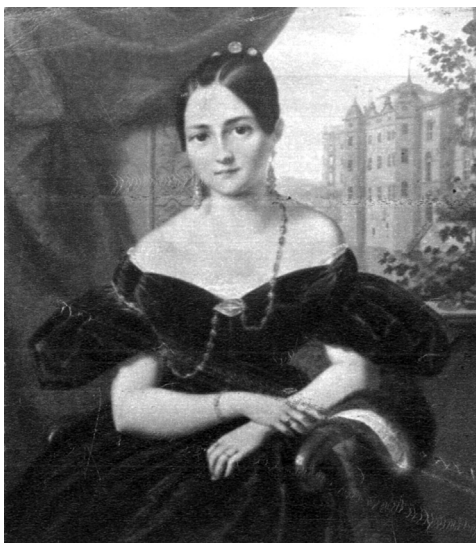
Александра Осиповна Смирнова-Россет