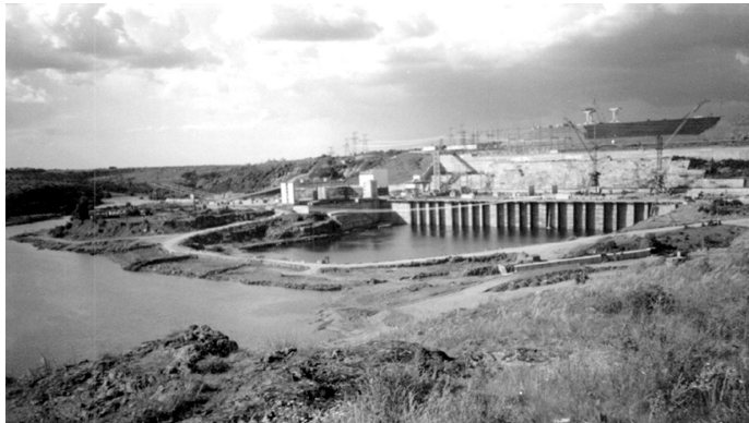
Ташлицька гідроакumuлююча електростанція

Історія добудови ТГАЕС більш-менш широко протягом останніх років висвітлювалася на сторінках місцевих ЗМІ.