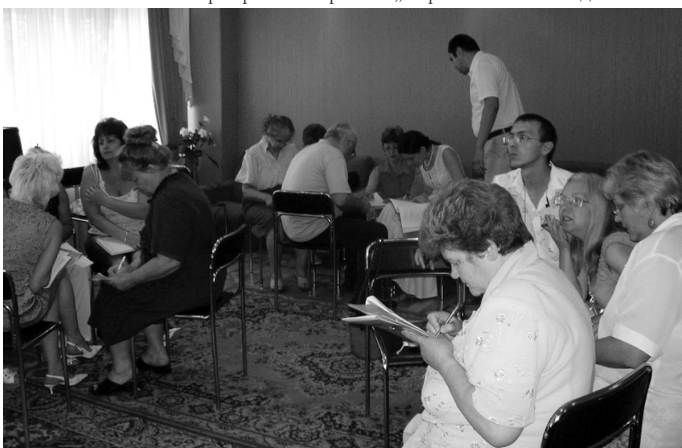
Тренінг „Стратегічний менеджмент соціальних проектів та програм” для партнерської групи стратегічного планування

ціальних проектів та програм”, в якому взяли участь 19 осіб, з них 13 осіб — представники місцевих НДО, 5 осіб — представники органів місцевого самоврядування, 1 особа — підприємець. На тренінгу обговорювались концепції розвитку таких напрямків, як робота з людьми з обмеженими мож-