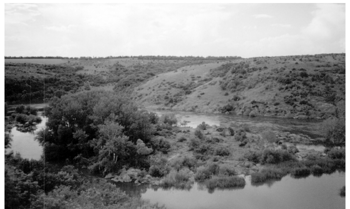
Напівзатоплений острів Гард, який ми рятуємо